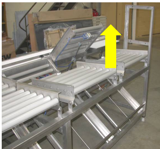
mise en place automatique