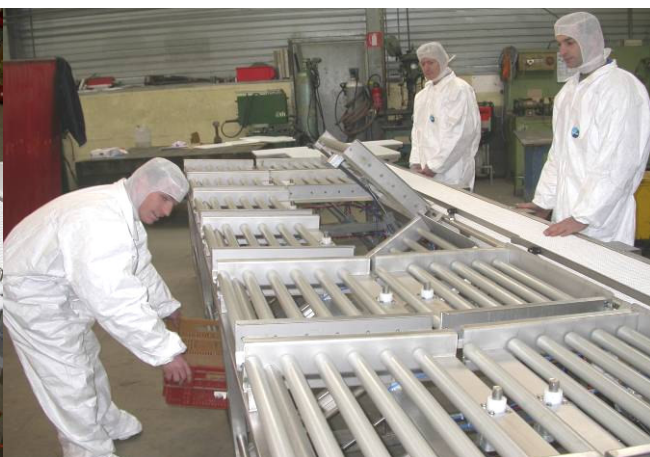
ergonomie des postes