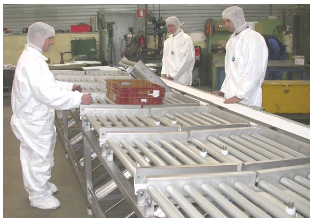
chargement des bacs

Énergie nécessaire = 1 alimentation en air comprimé 6 bars, 1 alimentation électrique < 2 kW)