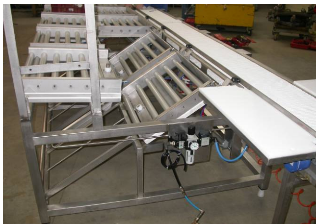
évacuation des bacs vides